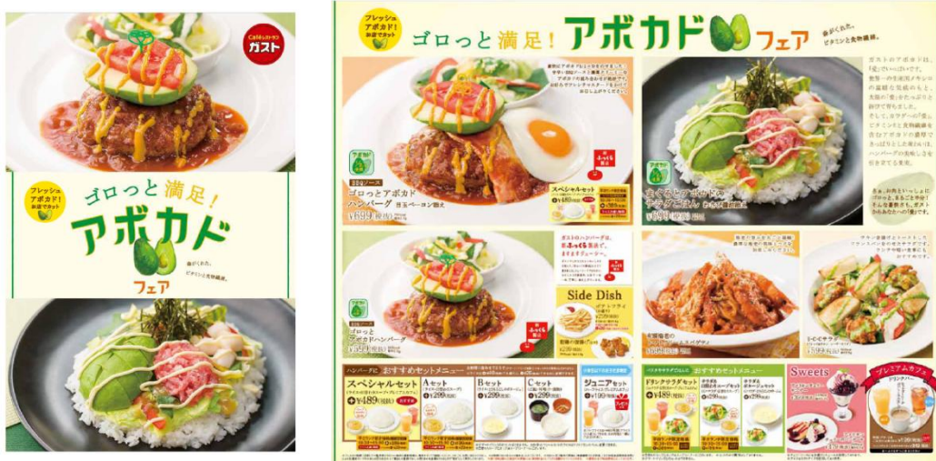
ゲストの「ゴロっと満足！アボカドフェア」メニュー