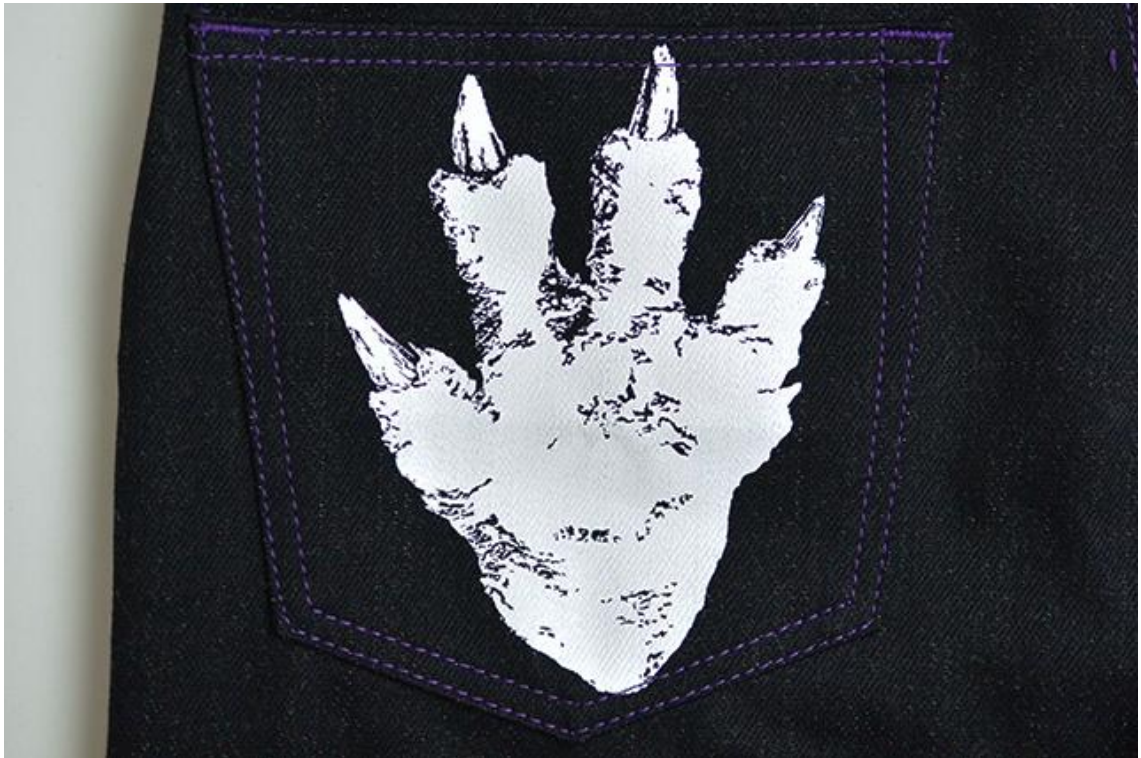
左ポケットにはゴジラの足跡