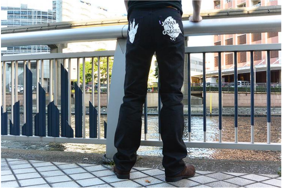
バックスタイルもワイルドに決まります (モデル身長177cm 体重70kg 32インチ着用)