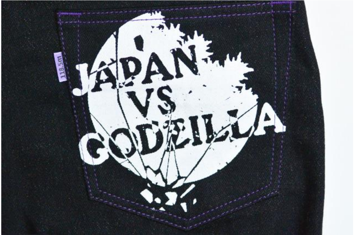
右ポケットには作品テーマを