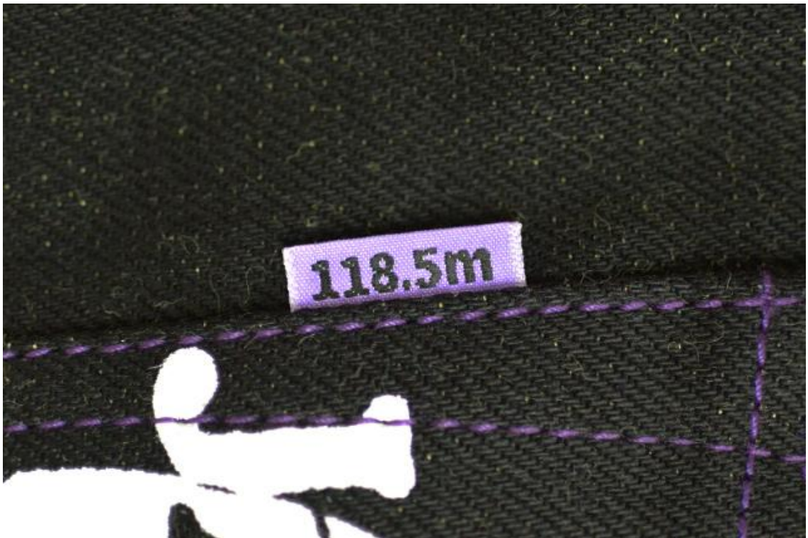
シン・ゴジラの体長をデザイン