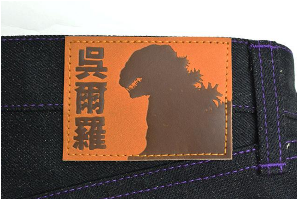
オリジナルの牛革パッチ