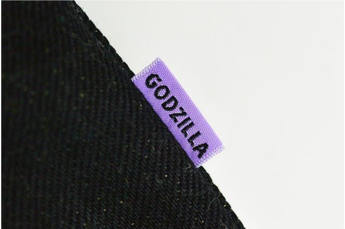
放射熱線をイメージしたカラー