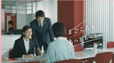
NA 「まごころを、 もっともっと」