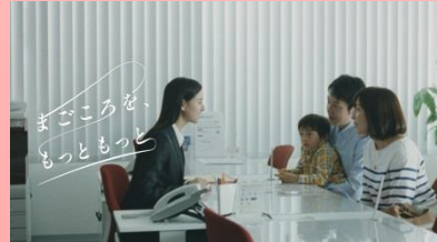
NA 「まごころを、 もっともっと」