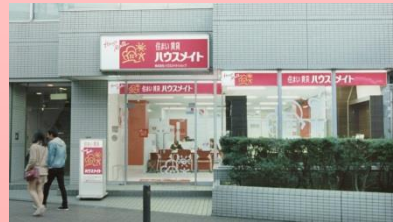
新木さん 「公園が 近くにあって…」