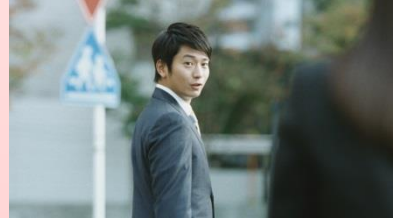
向井さん 「少し歩こう」