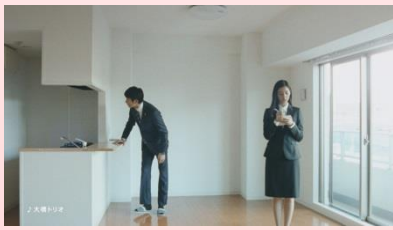
向井さん 「良いキッチンだね」