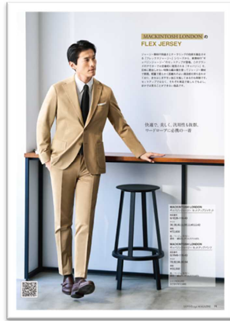
「MACKINTOSH LONDON」のベストセラーアイテム フレックスジャージーの新作「ギャバジンジャージー」のセットアップ