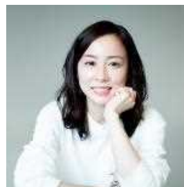
芥川賞受賞作家 綿矢りさ氏