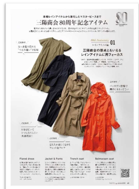
『SANYO Style MAGAZINE』紙版カタログ 80周年記念商品の紹介ページ