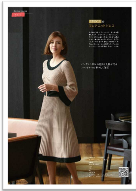
「EPOCA」のベストセラーアイテムのニットドレス フィット&フレアのシルエットがスタイル良く見ると人気