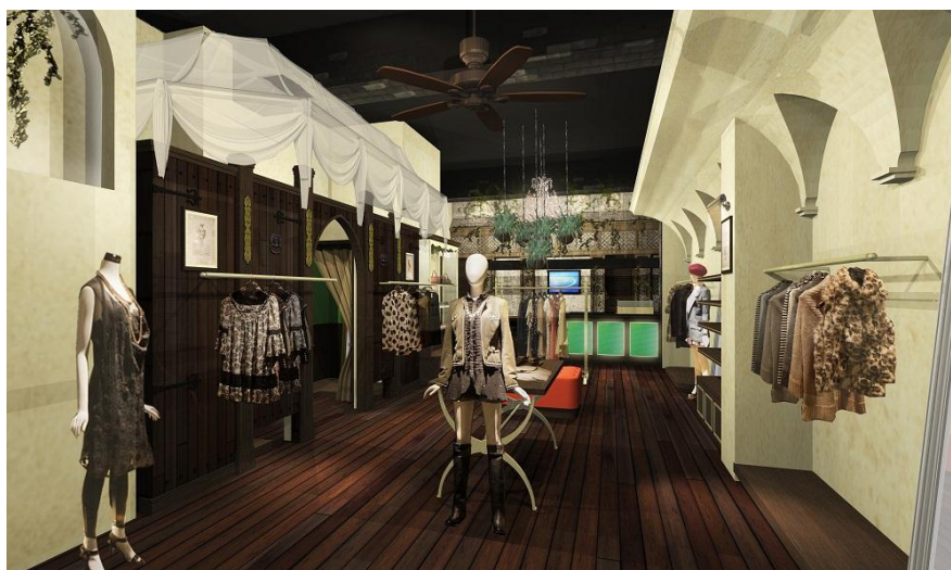
(「ラブレス京都」店内イメージ)