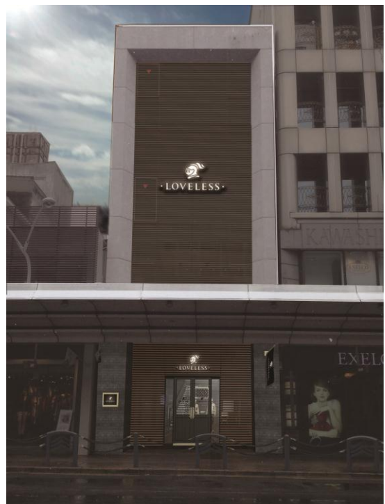
(「ラブレス京都」外観イメージ)

当社は、4年前に「ラブレス心齋橋」を大阪市にオープンしました。そのショップには京都等、大阪府外からのお客様も多く来店されて、“京都にもぜひショップを”という皆様の声を受けて社内で検討を重ね、京都市の主要な東西の通りのひとつである四条通沿いが同セレクトショップに適したロケーションということで、オープンに至りました。このたびオープンする「ラブレス京都」は、ラブレス青山、代官山、天神、心齋橋に続く5店舗目で、関西エリアではラブレス心齋橋に続く2店舗目になります。