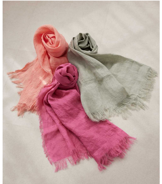
エス エssenシャルズ『ボタニカルダイリネストール』