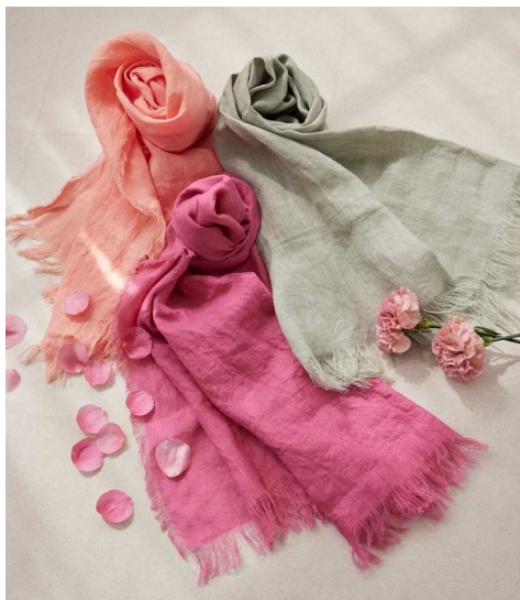
エス エssenシャルズ『ボタニカルダイリネンストール』

使い込むことで柔らかくなる麻素材を用いており、洗ってアイロンをかけると麻素材特有のハリ感が戻り、お好みに合わせた質感をお楽しみいただけるストールです。