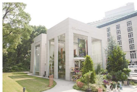
日比谷花壇 日比谷公園本店

株式会社日比谷花壇 企業サイト https://www.hibiya.co.jp/