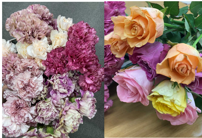
染料として実際活用した日比谷花壇より譲り受けた花の一部