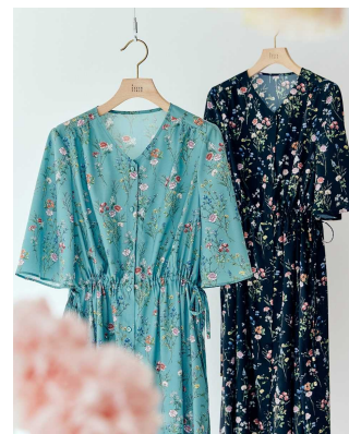
日比谷花壇のフロリストが描いた フラワープリントのワンピース(2024年夏物)

そして、2023年春夏シーズンからは、日比谷花壇のエグゼクティブフロリストが描いた“花とみどりのチカラ”を最大限に引き出したフラワーグラフィックをプリントに用いたワンピースやスカートなどコラボレーション商品を毎シーズン展開。母の日を前に発売する2024年夏向け商品においても、カーネーションとバラのプリントワンピースや雑貨アイテムを発売します。さらに日比谷花壇