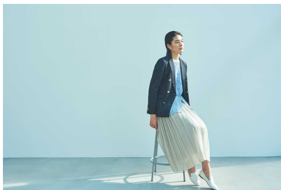
2024年春夏「S.ESSENTIALS」イメージビジュアル

https://store.sanyo-shokai.co.jp/pages/s_essentials