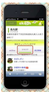
▼限定ゆるキャラグッズ例