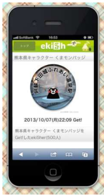
▼限定ゆるキャラバッジ例