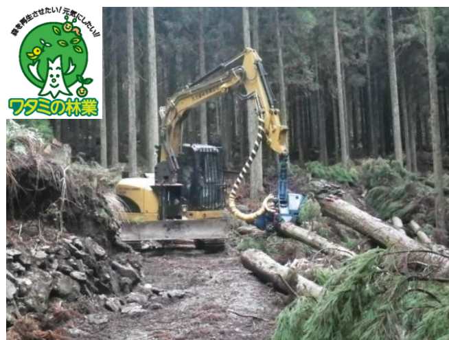
臼杵市内での林業施業

またワタミF&Eは、2014年に再生可能エネルギー(FIT 電源)を活用した電力事業にも参入しており、臼杵市においても公共施設や民間事業者へ電力を供給しています。