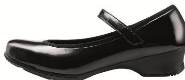
エナメルブラック