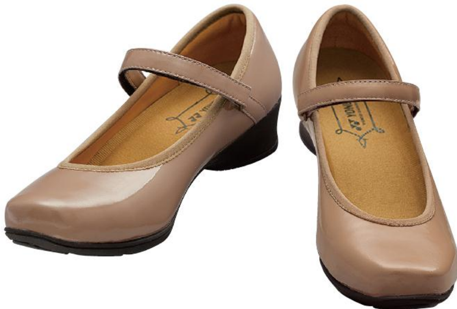
パワークッション LC67 エナメルピンク