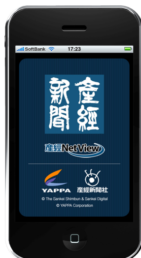
【図2】「産経新聞 iPhone 版」起動画面

「産経新聞 iPhone 版」の Ver 2.1.1 アップデート版より、新たに動画の再生機能が追加され、CRI の高画質・高機能ムービー再生システム「CRI Sofdec for iPhone/iPod touch」が採用されました。動画は新聞記事内に埋め込まれて再生されるため、ストレスのない自然な広告配信を実現しています。また単なる広告という枠を超え、エンターテインメント性に富んだ魅力ある動画コンテンツとして提供されています。