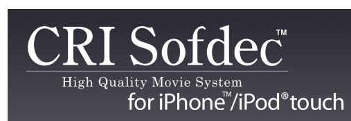
【図1】「CRI Sofdec for iPhone/iPod touch」ロゴ

株式会社CRI・ミドルウェア（本社：東京都渋谷区、代表取締役社長：鈴木久司、以下CRI）の高画質・高機能ムービー再生システム「CRI Sofdec for iPhone/iPod touch」が、株式会社ヤッパ（本社：東京都渋谷区、代表取締役社長：伊藤正裕、以下ヤッパ）が開発を担当する「産経新聞 iPhone 版」に、動画の再生エンジンとして採用されました。