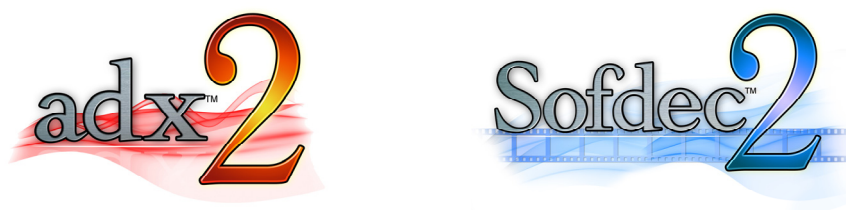
「CRI ADX2」 / 「CRI Sofdec2」 ロゴ

CRI は、今後も PS Vita をはじめとする各種ゲーム機のタイトル開発を強力にサポートして参ります。