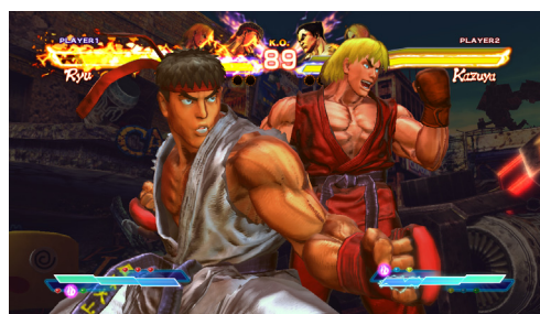
「STREET FIGHTER X 鉄拳」（カプコン）