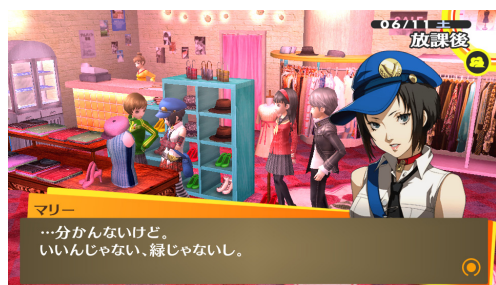
「ペルソナ4 ザ・ゴールデン」（インデックス）