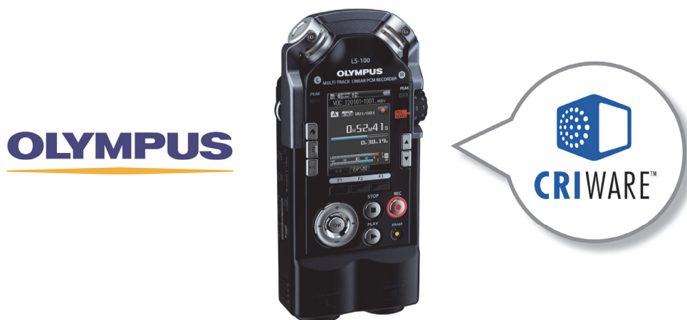
図：マルチトラック対応リニアPCMレコーダー「LS-100」

「LS-100」は高音質を誇るリニアPCMレコーダー「LSシリーズ」の最新機種で、音楽制作を可能にしたハイエンドモデルです。最大8トラックの同時再生・編集が可能なマルチトラック録音に対応し、楽器やボーカルを個別に録音し編集することで、楽曲制作も簡単に行うことができます。さらに外付けCDドライブを接続することで、PCを使わずに本体から音楽CDの作成も行えます。これまで据え置き型だったマルチトラックレコーダーが、持ち運びやすい手のひらサイズで実現されました。レコーディングをサポートする数々の便利な機能も搭載されており、プロミュージシャンも満足の高性能な1台です。