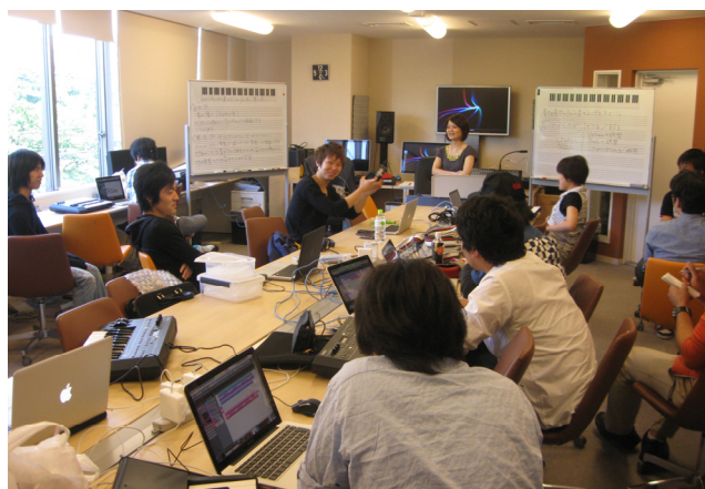
バンタンゲームアカデミー サウンドクリエイター専攻の授業風景

株式会社CRI・ミドルウェア（本社：東京都渋谷区、代表取締役社長 古川憲司、以下CRI）は、ゲームクリエイターを育てるゲーム専門校のバンタンゲームアカデミー（本社：東京都渋谷区、代表 長澤俊二）が7月から開講するサウンドクリエイター専攻の授業向けに、CRIのゲームサウンド制作用オーディオミドルウェア『CRI ADX™2』（以下『ADX2』）を提供致します。即戦力となる人材を育てるために、プロの開発環境を取り入れた実践的な授業を行いたいというゲームスクールからの強い要請に応え、CRIは開発環境を提供するとともに、優秀なクリエイターの育成を支援します。