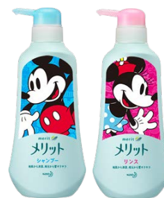
医薬部外品 髪と地肌をすこやかに保ちます。フケ・かゆみを防ぎます。

気温が低くなる秋冬は、分泌された皮脂が髪に移行する量が少なくなり、地肌に残る皮脂量が夏に比べて約1.6倍になります（花王調べ）。地肌に残った皮脂は長時間経つと、頭皮への刺激となり、紅斑を引き起こしやすくなり、頭皮トラブルも多く発生しています。また、湿度の低下によって頭皮からの水分蒸散量が増えることにより頭皮の水分量が低下し乾燥した状態になり、フケの発生へとつながります。