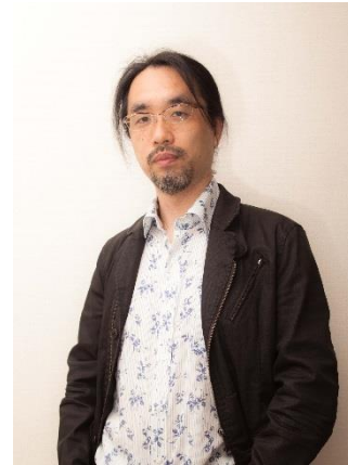
森脇 裕之 Hiroyuki Moriwaki ライト・アーティスト

日本国際美術展、宇部市現代彫刻展などに出品。66年ベネチア・ビエンナーレ展に出品、第9回高村光太郎賞を受賞。以後、第一回現代日本彫刻展神奈川県立美術館賞、第二回彫刻の森美術館賞、第4回倉文夫賞など次々に受賞。2000年には国際彫刻センター(ISC)優秀彫刻教育者賞をアジア人として初受賞。 http://www.morioshinoda.jp/