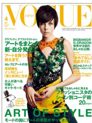
VOGUE JAPAN 2014年4月号

さらに、アーティスト、そしてスタイルアイコンとしても世界的に熱い視線を集めるBIGBANGのG-DRAGONが本号に登場します。イタリア版『L'UOMO VOGUE』や韓国版『VOGUE』の表紙を次々と飾るなど、ファッションとともに進化し続ける彼の魅力をグローバルな視点からひもとくほか、ヴォーグ読者のためだけに未発表のライブ写真を誌面で初公開します。