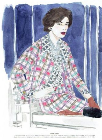
Color: Maiko Sembokuya © 2016 Condé Nast Japan. All rights reserved.

ディオールのエブニングドレスやシャネルのカーディガンスーツなどに、自由な感性で色をつけて楽しむことができます。