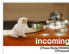
〈不在着信通知画面〉