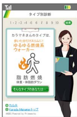
【ウォーキングプラン】