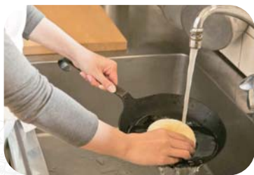
お鍋やフライパンを さっと流せる