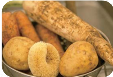
泥付きの野菜 皮むきにも