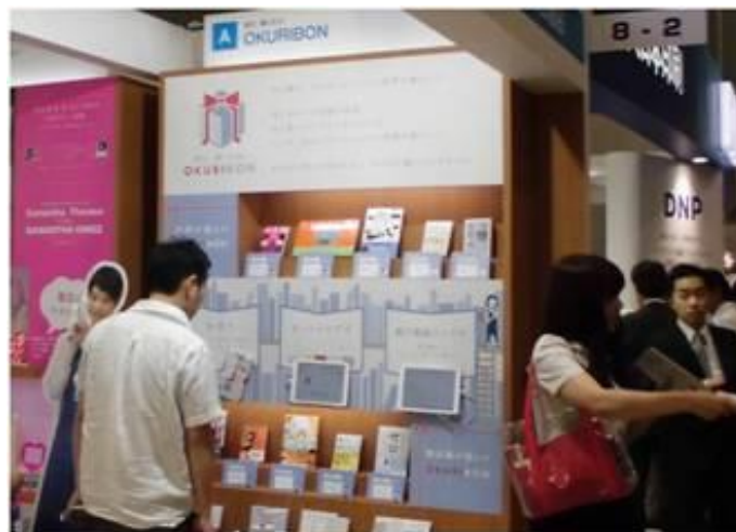
<昨年のイベントの様子>

今後も、『honto』は紙とデジタル両方(ハイブリッド)の強みを活かした書店サービスを目指します。