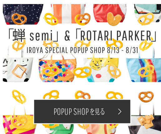
<EC サイトイメージ (特設バナー) >