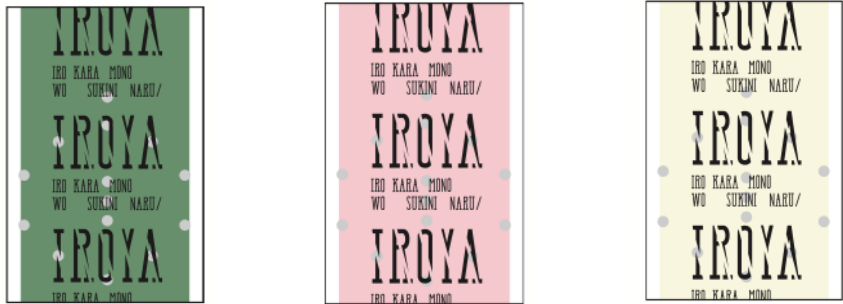
<IROYA用いろポチ ネームタグ (イメージ) >