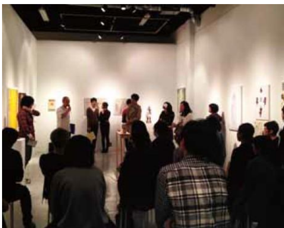
第 6 回東京アンデパンダン展 説明アンデパンダンの様子