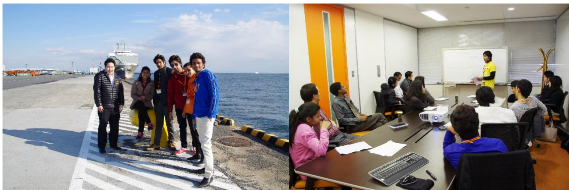
横浜港にて現地実習