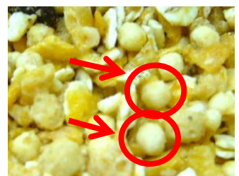
図2)ホワイトクリスプの密度の調節