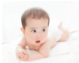
生後8カ月の赤ちゃん ※画像はイメージです。

※バストの測定数値はバストの中腹付近を1回測定した値です。 ※赤ちゃんのほっぺの測定数値はほっぺの中でも一番柔らかく、ふっくらしている真ん中を測定した値です。 ※肌の弾力性には個人差があります。