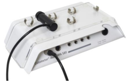
[弾力測定装置 CUTOMETER MPA580]

バストの弾力性測定中の動画はこちら: http://www.youtube.com/watch?v=4NEX_uDSzPU