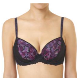
『天使のブラ ® 極上の谷間』

その結果、『天使のブラ ® 極上の谷間』を着けたバストは“皮膚の戻り率”87%、赤ちゃんのほっぺは“皮膚の戻り率”89%という結果になり、『天使のブラ ® 極上の谷間』を着けたバストは赤ちゃんに匹敵する弾力性であることが分かりました。