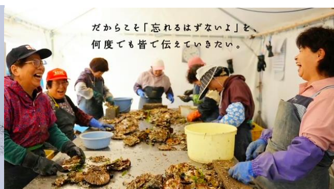
【画像】Search for 3.11 ランディング動画より