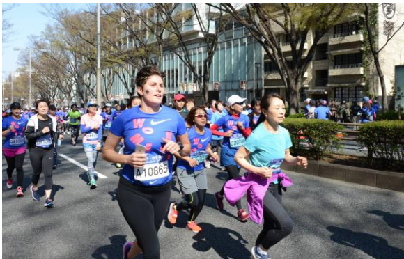
海外20ヵ国以上の女性ランナー100名も参加。表参道ヒルズ前を駆け抜けた