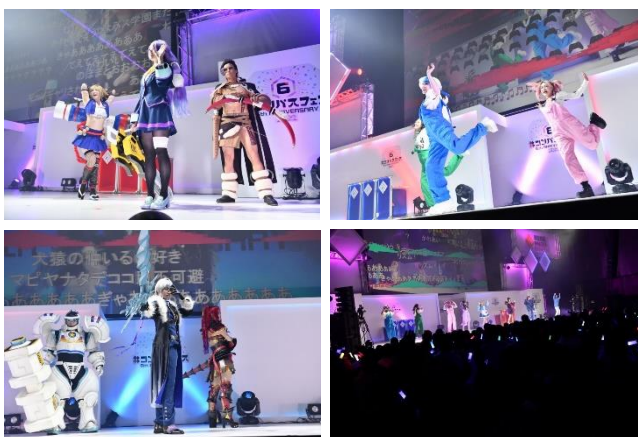
昨年の#コンパスフェスの様子

「#コンパスフェス」は、2017年より毎年開催している『#コンパス』の世界をリアルで体感できる大型イベントです。白熱したバトルが繰り広げられる公式大会やみんなで盛り上がるエンジョイバトルなどのゲームプレイのみならず、歌ってみた・踊ってみた・DJステージ、バンド演奏、公式コスプレイヤーによるコスプレ撮影会、「#コンパス人狼」など、コンテンツ展開の広さを活かした様々な企画を実施します。