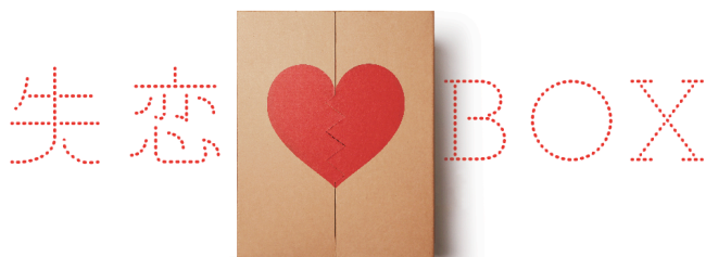
【画像】失恋 BOX 特設ページトップ