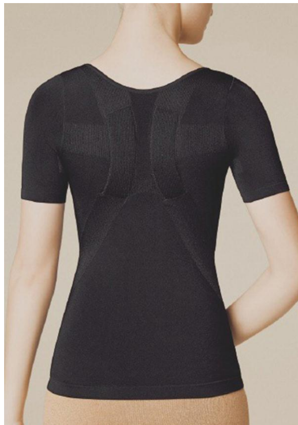
【着用商品】『背中おしもみトップス』THN200 (カラー:ブラック)

※TV通販、ウェブストア（ワコールウェブストア含む）では2014年11月より先行発売しています。