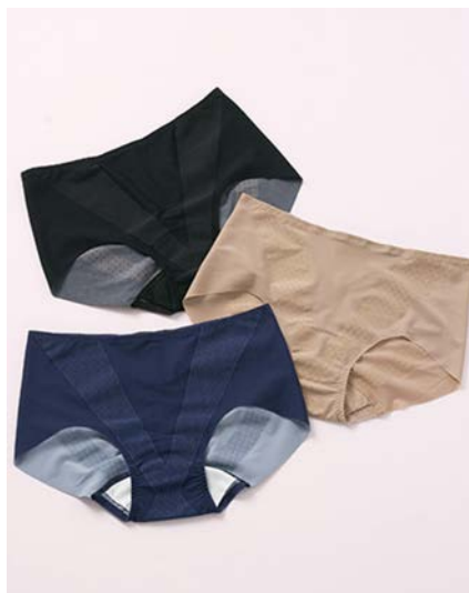
『研究所からのサニタリーショーツ』

日付は3と2でサニタリーの「サ（3）ニ（2）」の語呂合わせから、株式会社ワコールが制定。