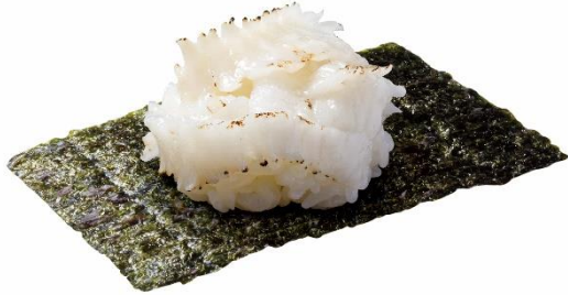
山盛り炙りえんがわつつみ 150 円 (税込 165 円)