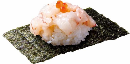
山盛り赤えびつつみ 150 円 (税込 165 円)