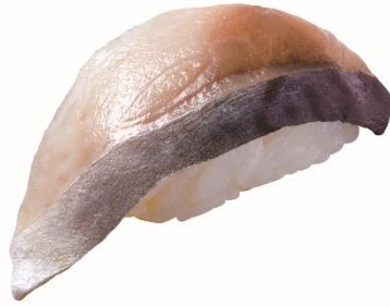
宮城県産 大切り金華しめさば 100 円 (税込 110 円)