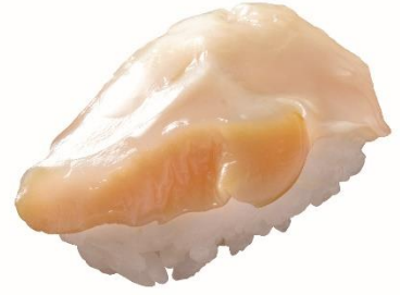
厚切りつづ貝 100 円 (税込 110 円)