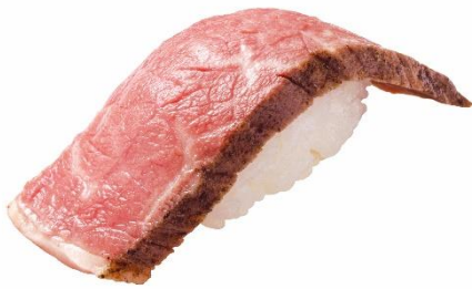
大切りいわて牛五ツ星握り 290 円 (税込 319 円)