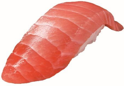
大切りまぐろはらみ 100 円 (税込 110 円)