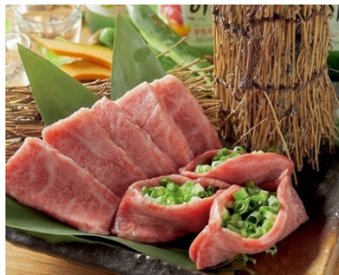
「爆汁！！ネギ包み厚切りタン」 2,420円