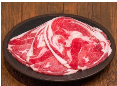
北海道名物「ジンギスカン」 760円