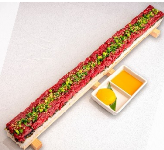
「特製ユッケ寿司50cm」 3,300円