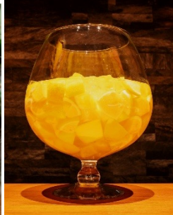
「ゆじろレモン」 (飲み放題に+980円)