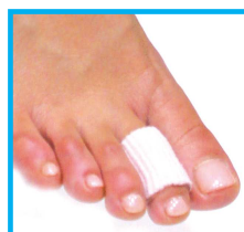
気になる部分につける