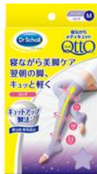
寝ながらメディキュット ロング