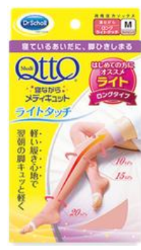
寝ながらメディキュット ライトタッチロング