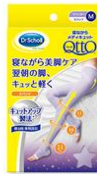
寝ながらメディキュット スパッツ