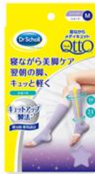
寝ながらメディキュット ショート