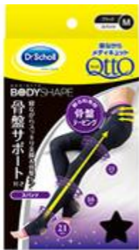
メディキュット ボディシェイプ スパッツ 骨盤サポート付き