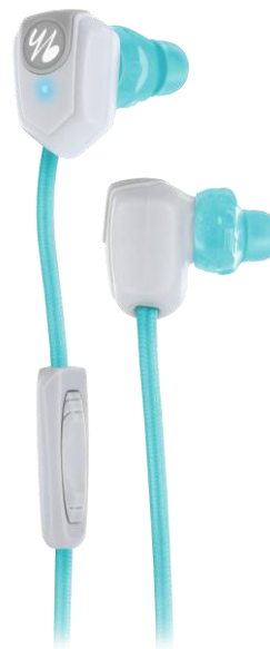
LEAP WIRELESS FOR WOMEN

ハーマンインターナショナル株式会社(本社:東京都台東区、代表取締役社長:仲井一雄)は、米国スポーツイヤホンブランド「yurbuds(ヤーバッズ)」の新製品2モデルを、HARMAN Store(ハーマンストア)、ハーマン公式通販サイト、全国のアップルストアで1月6日から先行で発売します。