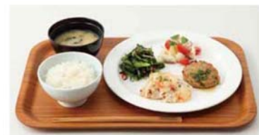
選べるデリ4品 ¥1000 Hot Delish品、Cold Delish品、ご褒またはリン