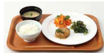
選べるデリ3品 ¥850 Hot Delish品、Cold Delish品、ご褒またはリン

衣、生、食という生活の全てのシーンでライフスタイルを提案する無印良品の世界が改装を機に更に広がることで、丸井吉祥寺店無印良品は、これまで以上に地域の皆様に愛される店舗として生まれ変わります。