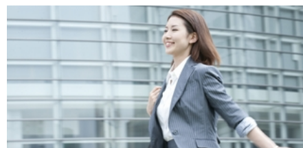
駅近の好アクセス！