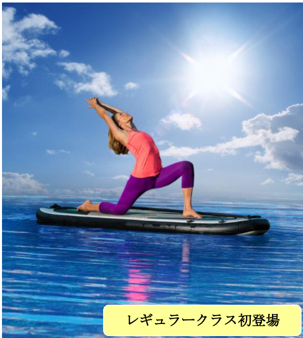
レギュラークラス初登場

3次元のストレッチ！カラダのあらゆる部位を“ひねって整える”『Twis-Tone supported by Reebok』 無心で楽しむ爽快アクアプログラム！水中の高強度インターバルトレーニング『X AQUA-FUN』