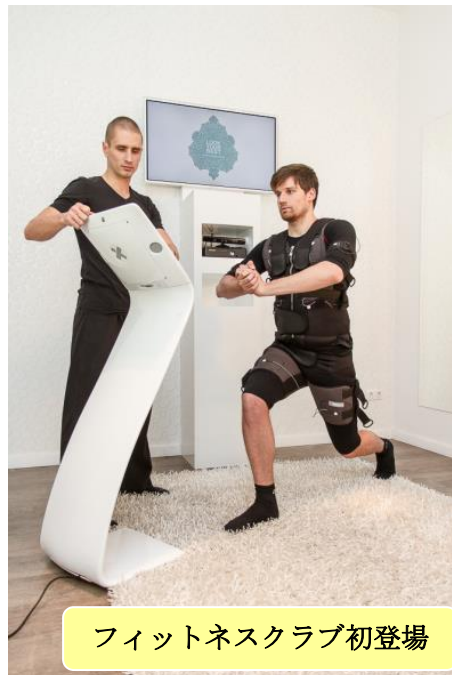
フィットネスクラブ初登場