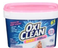
オキシクリーンベビー 1,370g/1,980円(税抜)