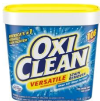
オキシクリーンEX 2,270g 2,480円(税抜)