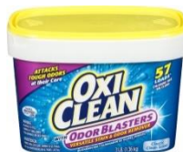
オキシクリーン デオドラントパウダー 1,360g/1,980円(税抜)