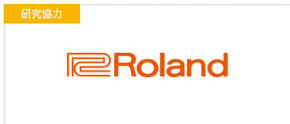
ローランド株式会社

海外では Alexa を通じて食料などを配達してくれるサービスや、ユーザーに適したニュース速報を提供するサービスなど、さまざまな場面で活用されています。cloudpack は日本での音声サービスの需要に応え、すでに Amazon Alexa を活用した下記のような開発実績があります。