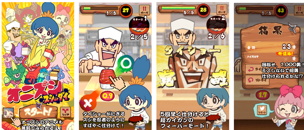
ゲームアプリ「オニズシ スシ or ダイ！」のスクリーンショット