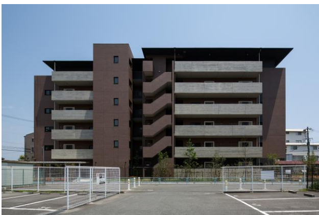
ブライロード西宮 外観

当物件は、当社設計・施工の賃貸マンションにおいても初の長期優良住宅認定物件であり、現在、愛知県名古屋市にて計画中の1物件も認定申請予定である。当社では建築費の増加はあるものの、入居者の関心がある性能を付加した当認定制度を、今後も積極的に提案していく予定である。