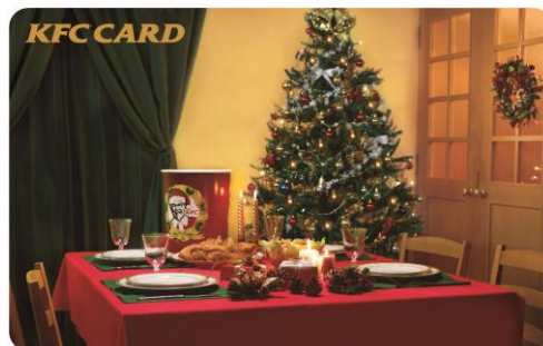
「KFC CARD」(左:KFC オリジナルデザイン、右:クリスマス限定デザイン) ※写真はイメージです。

「KFC CARD」は、バリューをチャージして繰り返し利用できる、チャージ機能付きのハウスプリペイドカードで、全国の KFC 店舗で発行、KFC の全メニューの購入時に利用できます。カードの発行は無料で、チャージ単位は 500 円単位、チャージ上限は 50,000 円です。なお、チャージしたバリューは最終利用日(もしくは最終チャージ日)から 2 年間有効です。また、「KFC CARD」をお持ちのお客様は、専用のマイページでカードの残高確認や残高移行を行うことができます。詳細は別紙をご参照ください。