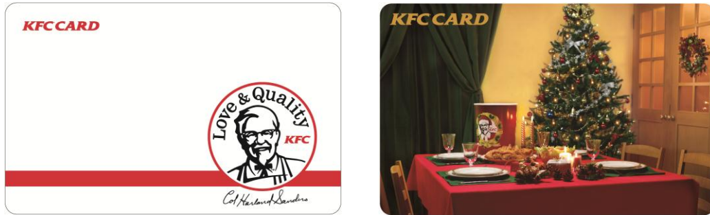
「KFC CARD」(左:KFC オリジナルデザイン、右:クリスマス限定デザイン) ※写真はイメージです。