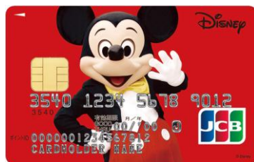
ミッキーマウス (レッド)