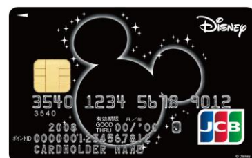
ミッキーマウス (ブラック)