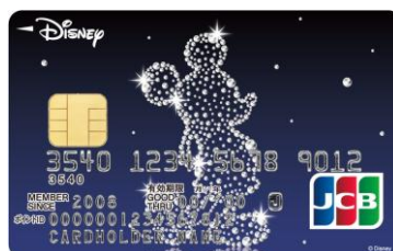
ミッキーマウス (クリスタル)