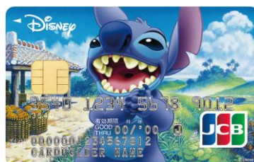
スティッチ (アイランド)