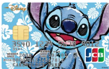
スティッチ (ハイビスカス)