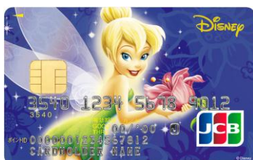
ティンカー・ベル