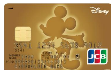
ミッキーマウス (ゴールド)