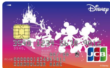
ファンタジックパレード(2016年6月30日受付分まで)