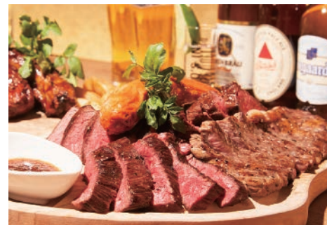
▲牛肉の炭焼き希少部位ステーキをがっつり