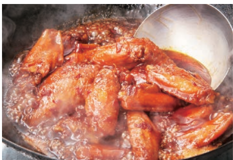
▲秘伝のタレで旨辛!手羽唐揚(税別450円(4個))