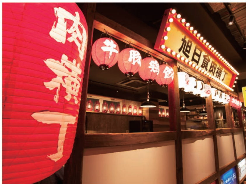
▲まるで肉のテーマパーク!いつでもワクワクした気分になれる

「庄や」など全国約750店舗の飲食店を展開する株式会社大庄(本社:東京都大田区、代表取締役社長:平 了寿)は、2016年6月10日(金)、東京・立川駅前(南口)に、本格的な「肉」料理を看板メニューとする個性派4店舗を集め「昭和の下町の風情漂う」横丁スタイルにデザインした、肉横丁「旭日食肉横丁」(あさひしょくにくよこちょう)の1号店「旭日食肉横丁 立川肉市場」をオープンします。牛肉、豚肉、鶏肉、羊肉、各種モツなど様々な肉料理を取り扱うお店を好みで気軽に選びハシゴして楽しめる、まるで「肉」と「酒」のテーマパークのような「肉好き」「酒好き」のための横丁です。