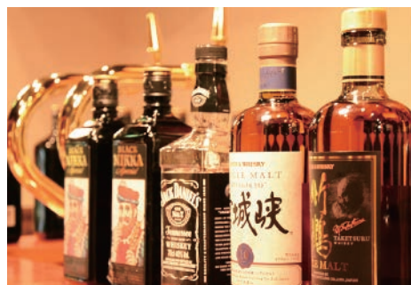
▲ハイボール各種 税別400円~550円