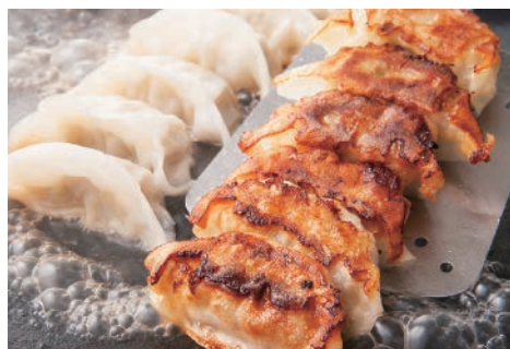
▲薄皮與一餃子 税別450円(7個)

全て店舗で丁寧に手包みする“ペロリと3皿は軽くいける”一口サイズの「薄皮與一餃子」は、揚げ焼きしたモチッパリッとした極薄皮の食感と肉のジューシーな旨味を楽しめる逸品。まずは餃子で生ビールを1杯、秘伝の特製ダレで味付けした刺激的な手羽唐揚でもう1杯、肉ミンチが激旨辛でクセになる台湾ラーメンでまた1杯、多彩な台湾辛料理で旨い酒がガブガブ飲める酒場です。 ◆営業時間:17:00~翌4:00 ◆席数:42席 ◆客単価:2,700円 ◆TEL:042-595-8907