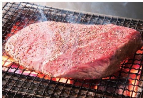
▲塊肉を豪快に炭火焼に(1ポンド税別3,820円)