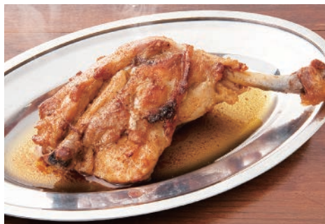
▲もも肉丸ごと!「名物ピヨ吉焼き」税別600円