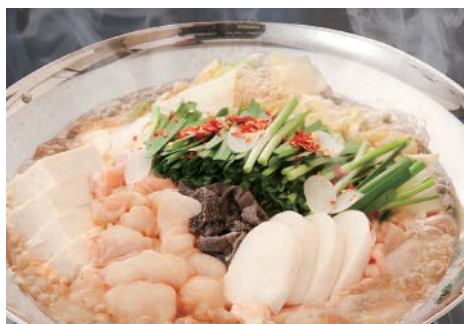
▲もつ鍋(博多・筑豊)セット税別1,200円(1人前)