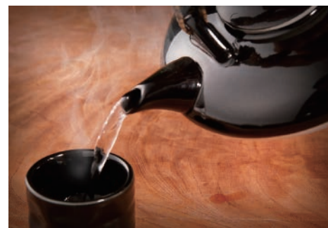
▲前割り黒霧島の黒じよか(1合)税別550円