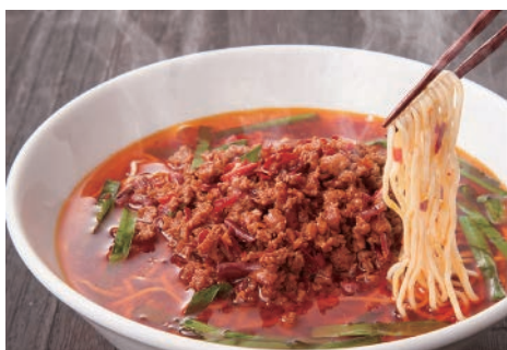
▲激旨辛の名物台湾ラーメン 税別650円