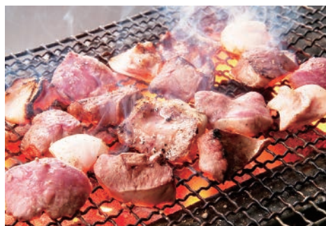
▲名物焼きとん「ミックス」税別680円

◆営業時間:17:00~翌3:00 ◆席数:46席 ◆客単価:3,200円 ◆TEL:042-595-8905