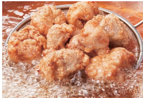
▲特製もも唐ミックス盛り(3種×2個)税別600円

熱々ジューシーな鶏から揚げとキンキンに冷えたハイボールをメインにした、気軽に寄れてホッと落ち着くノスタルジックな空気が流れる“癒しの”から揚げ&ハイボールバー。ちょっと1杯飲みなおしたい気分のおときも美人店長と女性スタッフのおもてなしで料理とお酒を味わえば、至福の時間を過ごせます。ハイボールや生ビールは1リットル男前サイズもご用意しています。 ◆営業時間:17:00~翌5:00 ◆席数:14席 ◆客単価:2,300円 ◆TEL:042-512-8644