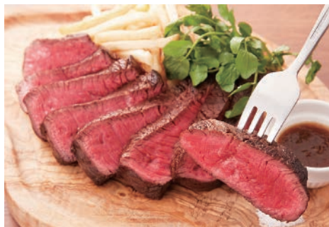
▲ランプキャップステーキ(180g)税別1,570円