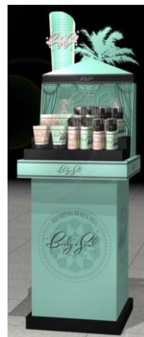
店頭ディスプレイイメージ ※大型店のみの取り扱い。

Urban Comfort Urban Comfort (アーバンコンフォート)