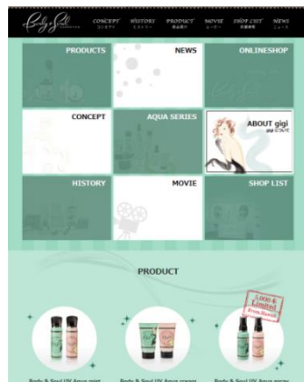
「Body & Soul COSMETICS」公式HP

会社名 : ボディ アンド ソウル ジャパン株式会社 (Body & Soul Japan株式会社) 代表取締役 : 森 健太郎 資本金 : 10,000,000円 所在地 : 東京都渋谷区千駄ヶ谷1-5-8 ジュニア千駄ヶ谷3F 電話番号 : 03-5413-4288 URL : http://bodyandsoulcosmetic.com/