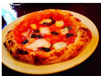
Pizzeria da Pepino(大阪)