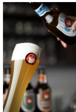
常陸野ネストビール(茨城)