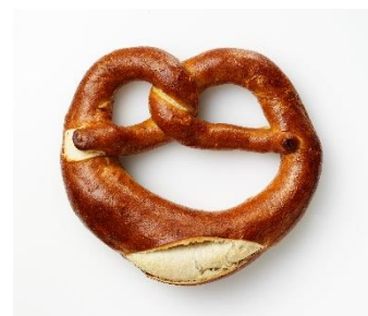
パティシエ エス コヤマ(兵庫)